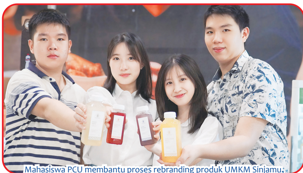
Mahasiswa PCU membantu proses rebranding produk UMKM Sinjamu.

siswa PCU dari berbagai program. Mereka dibagi menjadi 25 kelompok terdiri empat orang. Dimana masing-masing kelompok, menuntun satu brand UMKM pilihannya,” ungkap Feni.