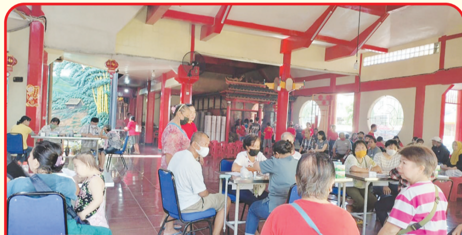
Masyarakat dan umat antusias mengikuti pemeriksaan kesehatan.