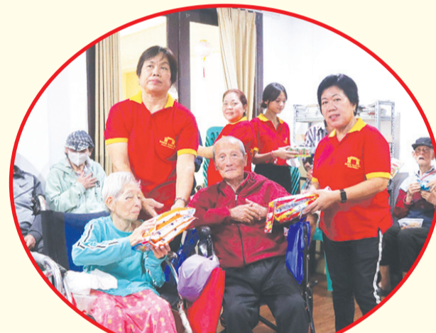
Para pengurus Vihara Nimmala (Boen San Bio) memberikan bingkisan kepada para lansia.