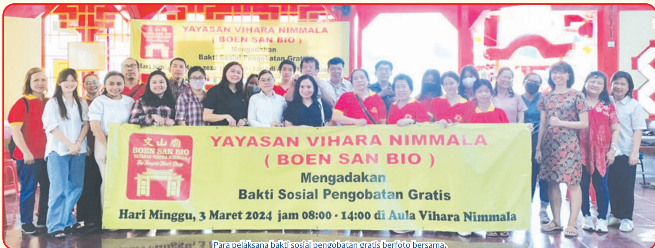
Para pelaksana bakti sosial pengobatan gratis berfoto bersama.

TANGERANG (IM) - Dalam rangka memperingati Sejet Kongco Tek Tjeng Sin ke-335, pengurus Vihara Nimmala (Boen San Bio) di Jalan Pasar baru No 43, Kelurahan Pasar Baru, Kecamatan Tangerang, Kota Tangerang, menggelar Baksos (bakti sosial) berupa pengobatan gratis, pembagian sembako bagi masyarakat sekitar dan pemberian bingkisan kepada lansia di panti.