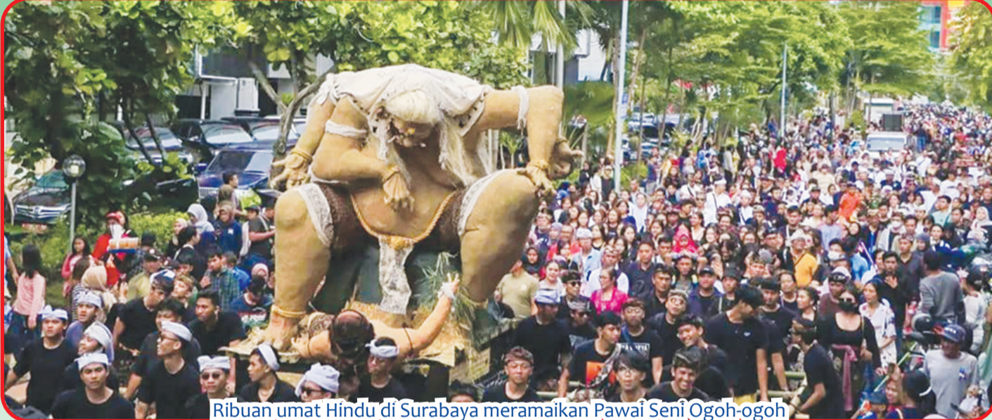
Ribuan umat Hindu di Surabaya meramaikan Pawai Seni Ogoh-ogoh