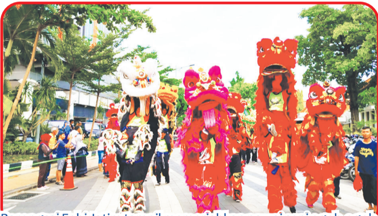
Barongsai Fobi Jatim tampil memeriahkan pawai seni ogoh ogoh.