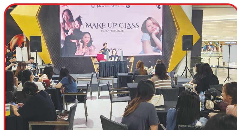
Suasana Workshop Korean Everyday Makeup Look di BDM Festival 2024.